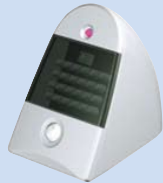
アリバイセンサー (MKS-AS)